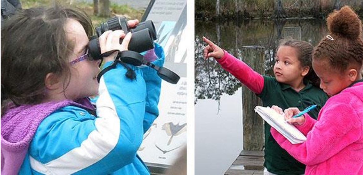
Jóvenes observadores de aves.