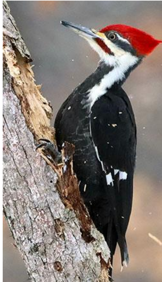
Pájaro carpintero